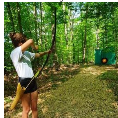
Abbildung 3 Die Jobentdecker waren unter anderem Bogenschießen...

Bewegung an der frischen Luft beim Stand-Up-Paddling auf dem Main, Zielgenauigkeit beim Bogenschießen im Steigerwald oder Einfühlungsvermögen bei einer Lama-Tour in den Haßbergen, auch hier war wieder voller Einsatz von den Jugendlichen gefordert.