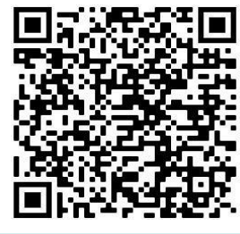
Übersicht für Eltern & Lehrkräfte