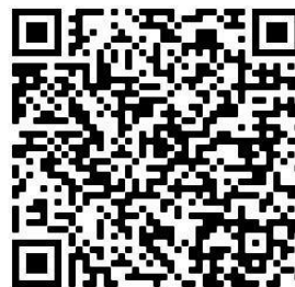
Übersicht für SchülerInnen

Aufgrund der Corona-Pandemie sind viele klassische Möglichkeiten der Berufsorientierung wie Messen und Praktika aktuell leider wieder nicht möglich. Im Auftrag des Netzwerks Schule-Wirtschaft Landkreis Haßberge hat die Bildungsregion daher bereits Anfang des Jahres eine Sammlung von aktuellen digitalen Angeboten zur Berufsorientierung zusammengestellt. Es gibt sie in zwei Ausführungen, jeweils als PDF-Datei: für Schüler/Jugendliche sowie für Lehrkräfte und Eltern. Diese sind sicherlich nicht vollständig, können aber einen ersten Einblick in neue digitale Angebote und Inspiration für die (begleitende) Berufsorientierung bieten.